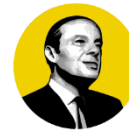
Instituto de Derechos Humanos y Construcción de Paz Alfredo Vázquez Carrizosa

Comunicado de Prensa Misión de Verificación de la ONU en Colombia